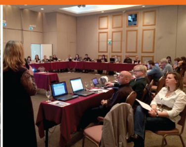
Athens, 26-27 February 2015