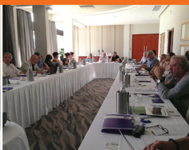
Malta, 23-24 October 2014