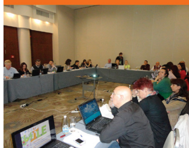
Sofia, 24-25 April 2014